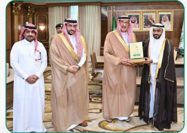
أمانة منطقة جازان