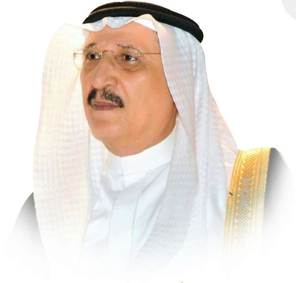
أمين منطقة جازان

الأمير محمد بن ناصر بن عبدالعزيز آل سعود