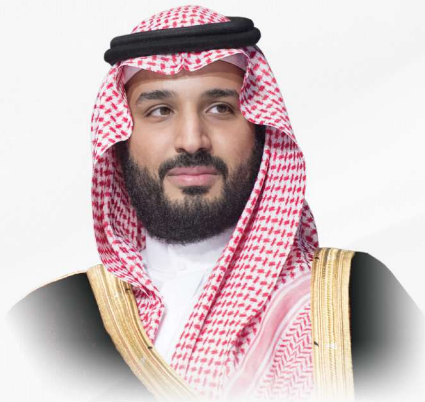
صاحب السمو الملكي الأمير