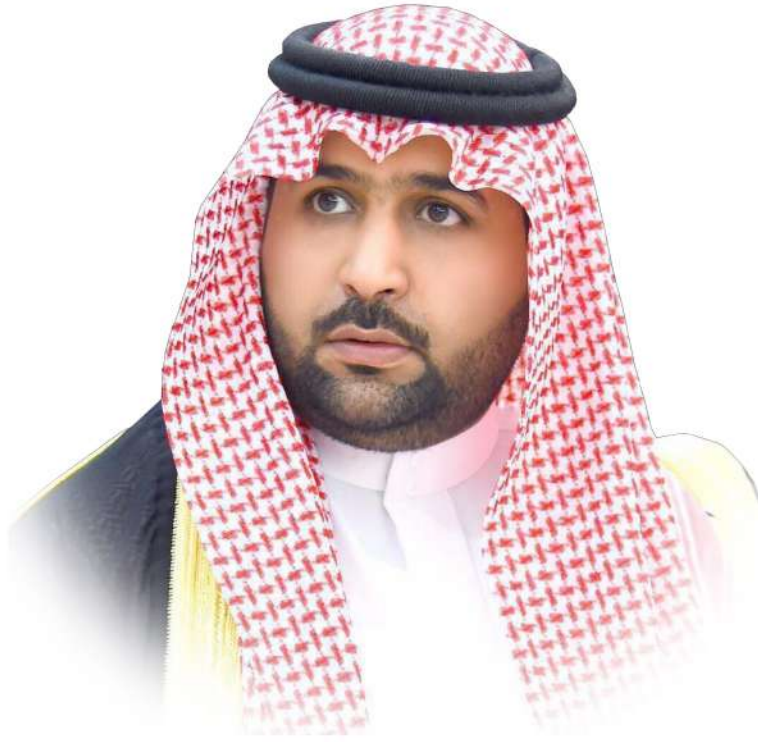
نائب أمين منطقة جازان