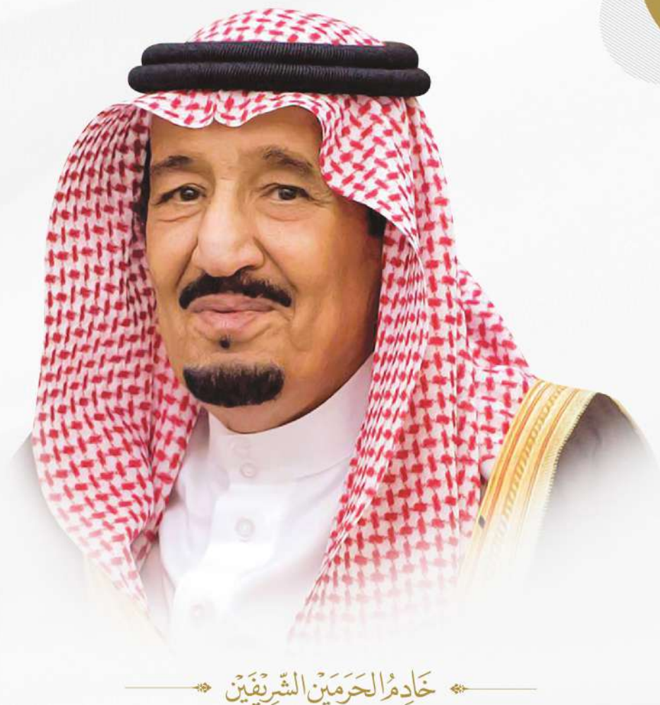
خادم الحرمين الشريفين