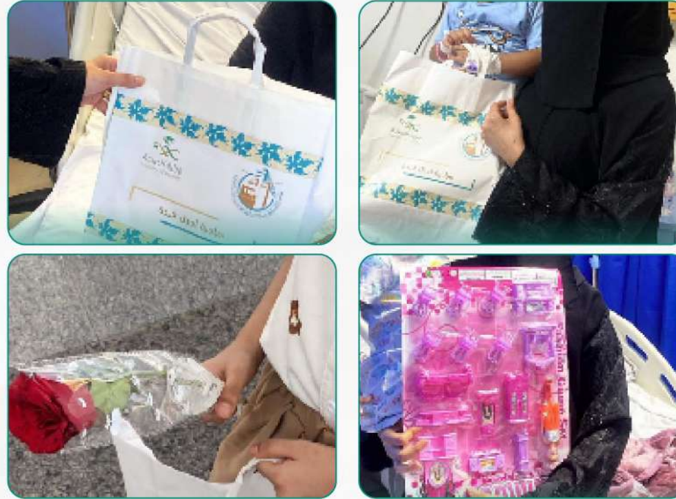
مبادرة تطوعية أدخل فرحة زيارة قسم الأطفال والإحتفاء بهم في مستشفى الملك فهد جازان العام