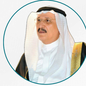
صاحب السمو الملكي الأمير محمد بن ناصر بن عبدالعزيز آل سعود رئيس مجلس الإدارة