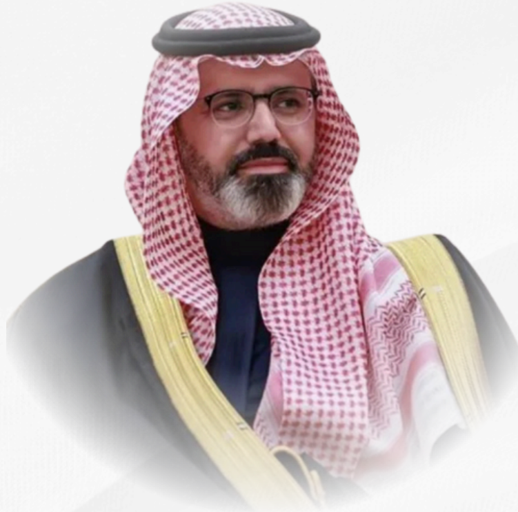
نائب أمير منطقة جازان