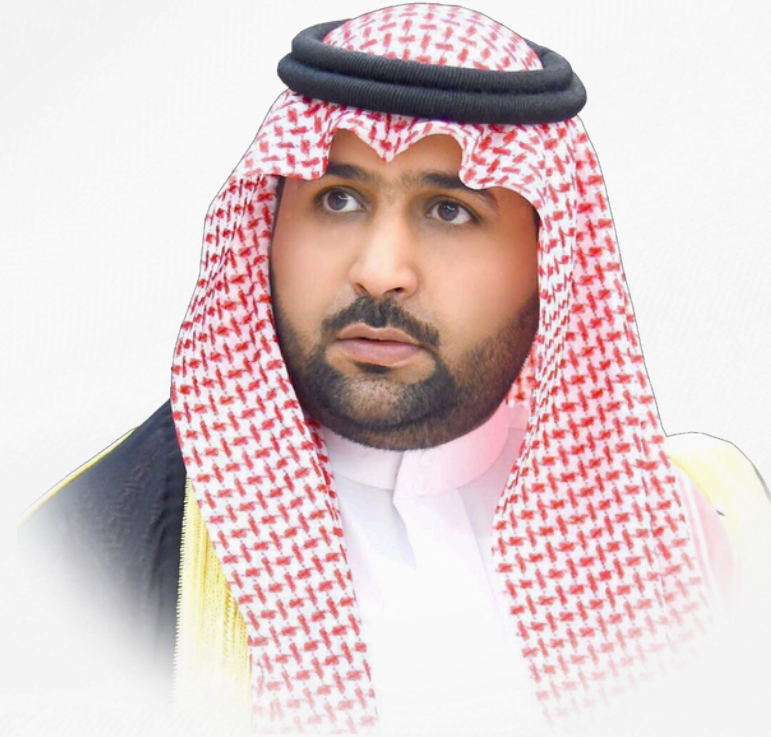
أمير منطقة جازان

الأمير محمد بن عبد العزيز بن محمد بن عبد العزيز السعوي